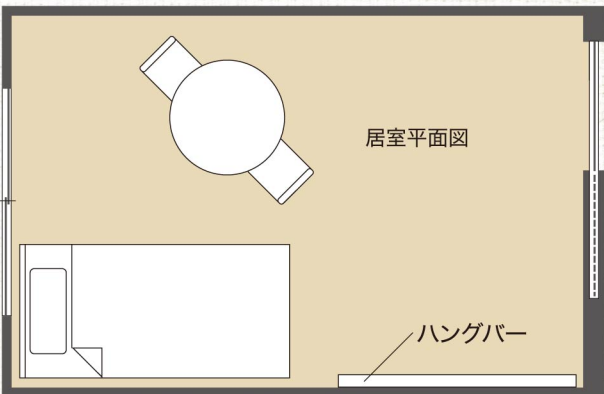
※図面内の家具は含まれません。

朝昼夕の食事の準備や片付け、共有部分の清掃・管理など、保守管理サービスをしています。